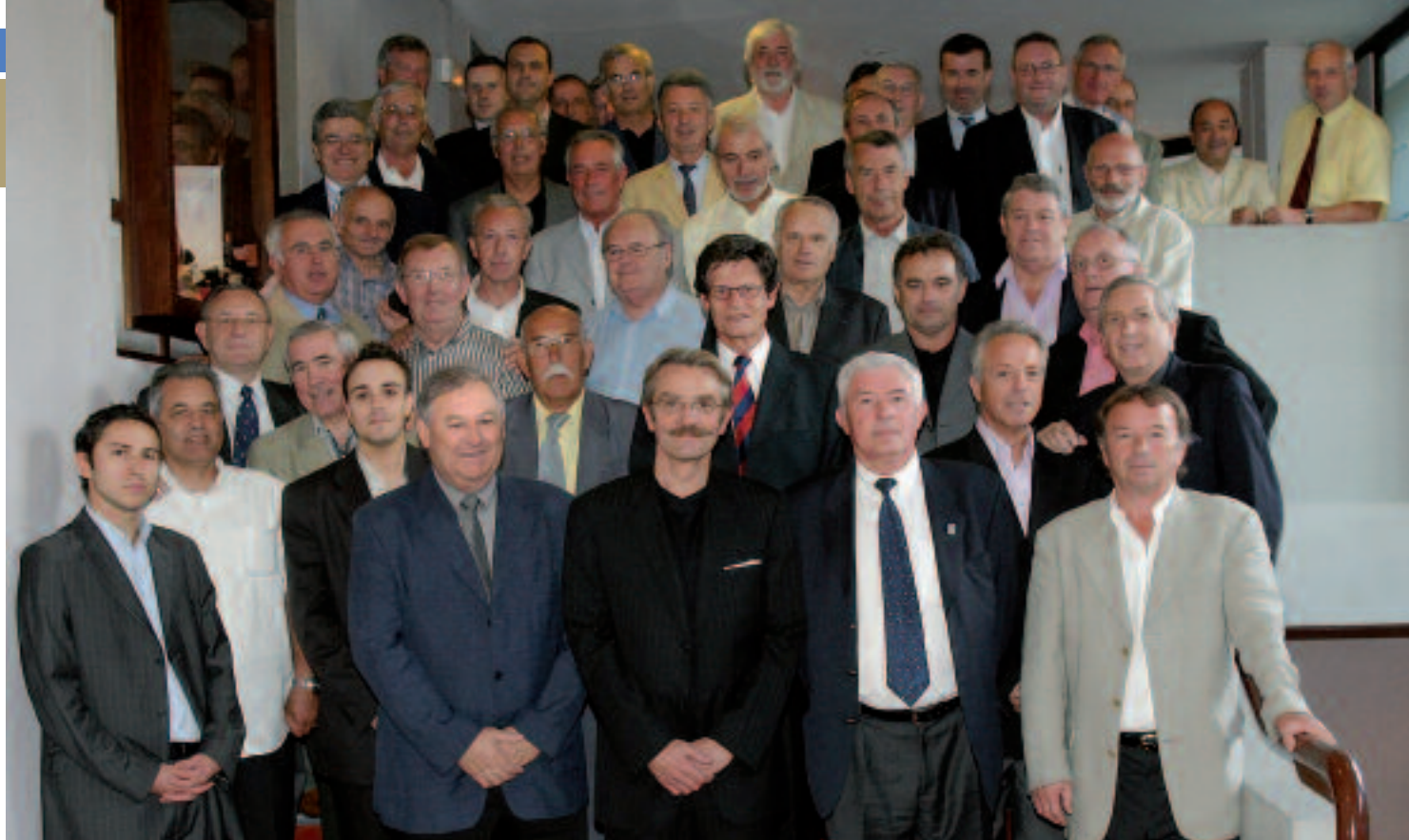
Photo de famille lors du séminaire formation délégués (Paris) - 26/27 juillet 2008