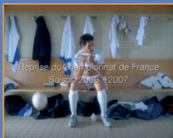
La campagne de communication de la LFP pour la reprise du Championnat de France