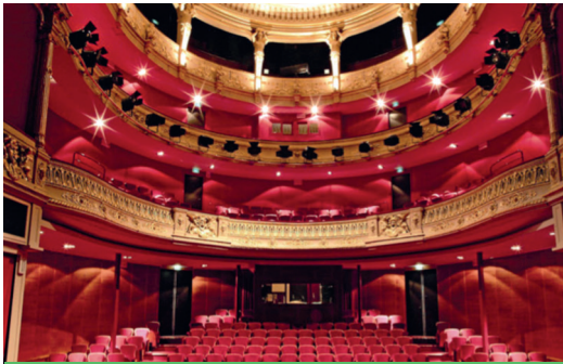
Théâtre, musique, arts : De l'émotion sans suspense

C'est pour préserver l'intégrité du sport et des sportifs qu'il faut lutter ardemment contre le trucage des compétitions et contrôler autant que possible les paris sportifs. Sans incertitude, le sport professionnel perd l'essentiel de sa valeur économique et perd généralement rapidement ses partenaires (sponsors, médias, mais surtout spectateurs).