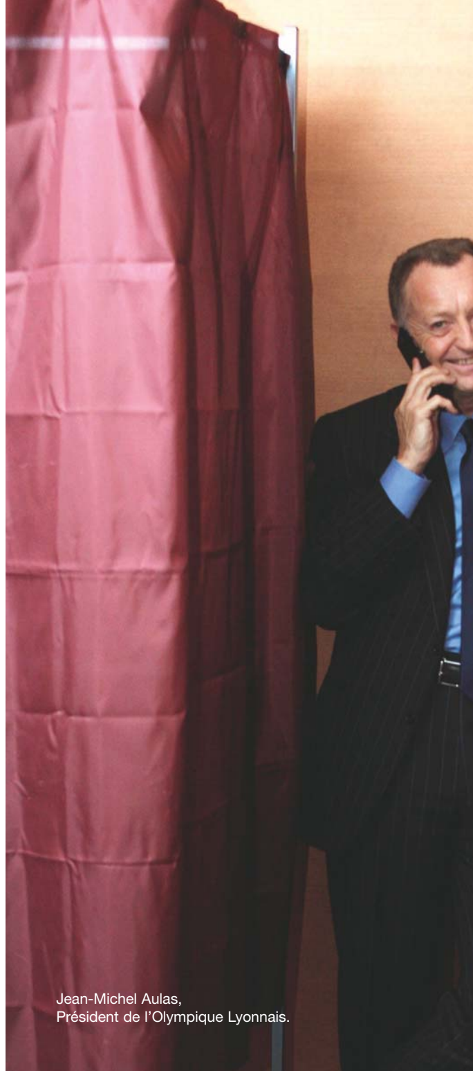
Jean-Michel Aulas, Président de l'Olympique Lyonnais.