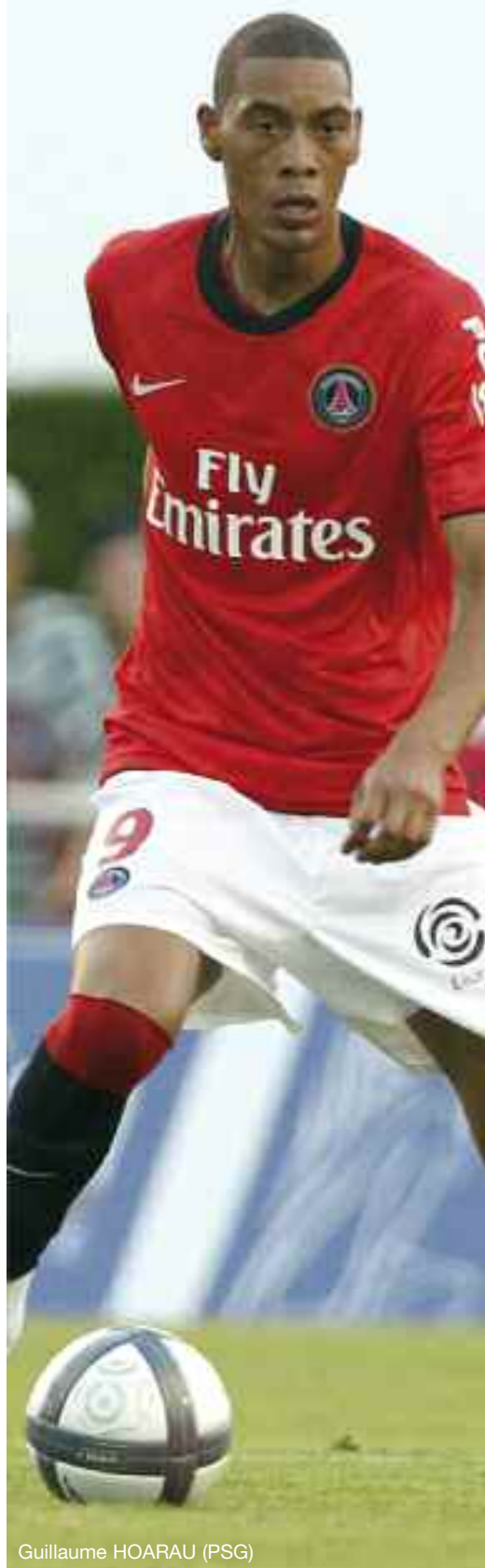
Guillaume HOARAU (PSG)

Didier Deschamps et Antoine Kombouaré ont évolué ensemble au FC Nantes pendant quatre saisons et demie entre 1985 et novembre 1989. Les deux hommes vont disputer leur tout premier Trophée des Champions.